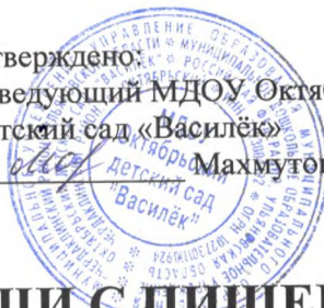
ГРАФИК ВЫДАЧИ ПИЩИ С ПИЩЕБЛОКА